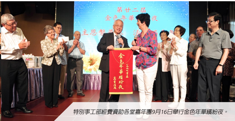
特別事工部經費資助各堂嘉年團9月16日舉行金色年華繽紛夜。

ACEM 華人基督傳道聯會 Association of Christian Evangelical Ministries (Canada) 主辦：華基聯會媒體資源部