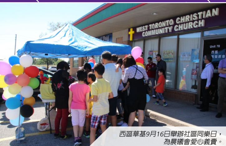
西區華基9月16日舉辦社區同樂日，為晨曦會愛心義賣。