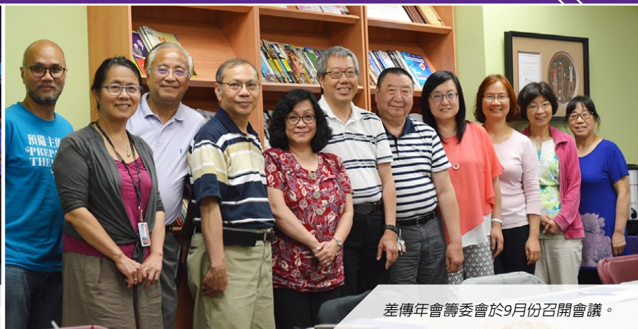
差傳年會籌委會於9月份召開會議。